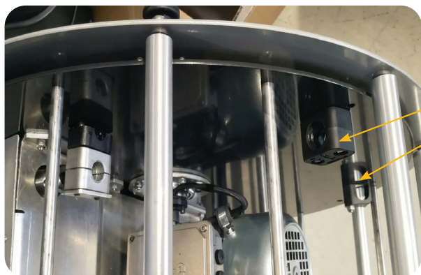
Guides - 2 stk