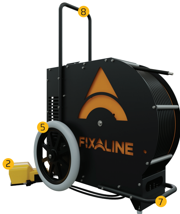
Figur 1. FIXER 10 Hoveddel