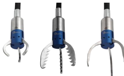
Tre forskellige gribeklør

TILBEHØR: 2,5 mm unbrakonøgle og smøremiddel